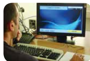
Remotizzazione Touch Screen (opzionale).