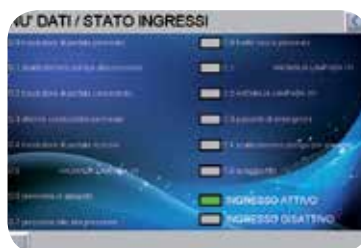
Schermata menu dati/stato ingressi.