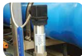
Trasd. pressione electr. (di serie).