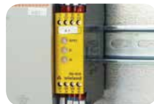
Relè di sicurezza a norma EN60204-1.