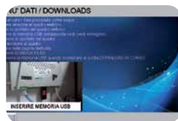
Schermata menu dati/downloads.