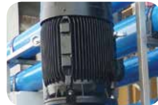
Gruppo di pressurizzazione con pompa ad asse verticale inox.