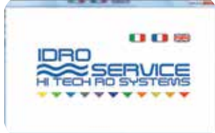
Touch Screen 7" WIDE a colori.

Le osmosi BW utilizzano esclusivamente componenti certificate per acque potabili.