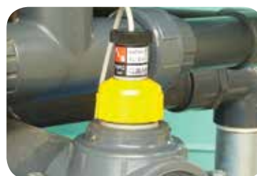
Trasd. portata elettr. (opzionale).