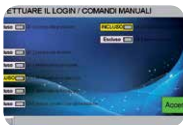
Schermata di Login/comandi manuali.