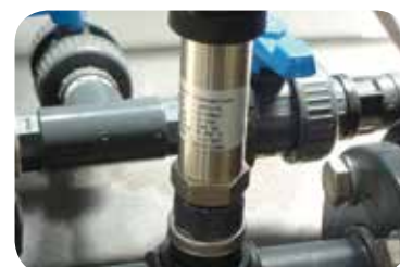
Trasd. pressione elettr. (opzionale).