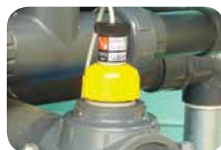
Trasd. portata electr. (di serie).