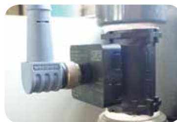
Trasd. portata elettr. (opzionale).