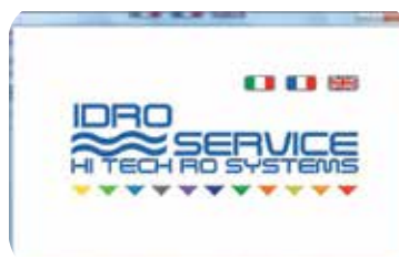
Schermata menu Home.