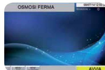
Schermata di osmosi ferma.