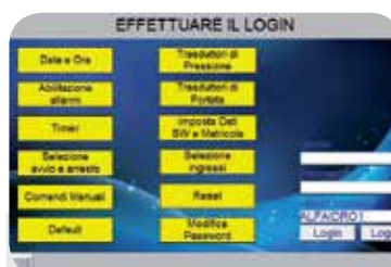
Schermata di Login.