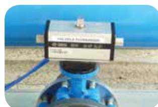
E.V. flusso acqua pulita (opzionale).