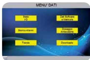
Schermata menu dati.