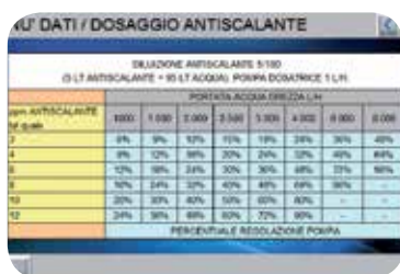
Schermata menu dati/dosaggio antiscalante.